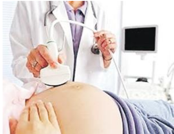
Teknologi imbasan terkini mampu menghasilkan imej 3D dan 4D.

Maka lahirlah ultrasound imbasan 3 dan 4 Dimensi (3D dan 4D) yang memberi lebih kepuasan dari segi penampilan rupa dan bentuk anggota bayi. Poliklinik Penawar Semenyih